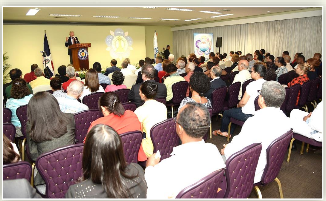
'The Inner Path: Reaching Realisation through Human Values'